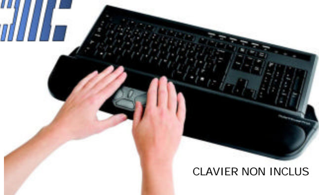
CLAVIER NON INCLUS