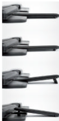
Nouveau support à clavier ajustable.